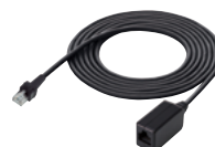
OPC-2355 Länge: 2,5 m