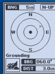
Pop-up-Fenster zur Positionsermittlung