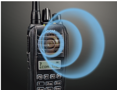
1500 mW NF-Leistung