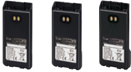
BP-278 BP-279 BP-280

BP-278: 1190 mAh (typ.), 1130 mAh (min.) aufladbarer Li-Ionen-Akkupack BP-279: 1570 mAh (typ.), 1485 mAh (min.) aufladbarer Li-Ionen-Akkupack BP-280: 2400 mAh (typ.), 2280 mAh (min.) aufladbarer Li-Ionen-Akkupack