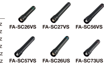
FA-SC26VS FA-SC27VS FA-SC56VS FA-SC57VS FA-SC26US FA-SC73US