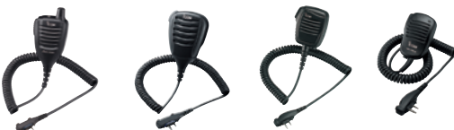
HM-171GPW HM-168LWP HM-159LA HM-158LA

HM-158LA: Kompaktes Lautsprecher-Mikrofon mit 3,5-mm-Stecker