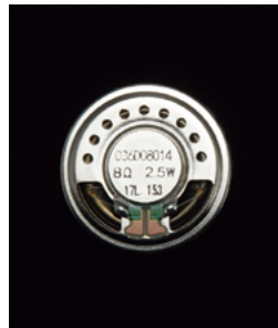
Icoms spezieller Hochleistungs-Lautsprecher