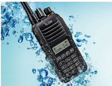
Wasserdicht für 30 Minuten in 1 m Tiefe