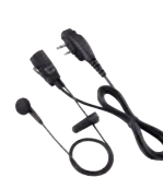
HM-166LA Leichtes Revers-Mikrofon mit Ohrhörer