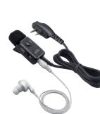
HM-153LA Stabiles Revers-Mikrofon mit Ohrhörer