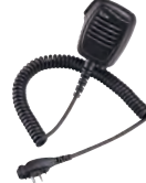
HM-159LA Großes, stabiles Lautsprecher-Mikrofon