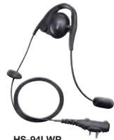
HS-94LWP Ohrhörer-Headset mit Bügelmikrofon für freihändigen Betrieb