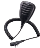
HM-168LWP IP67-wasserdichtes Lautsprecher-Mikrofon