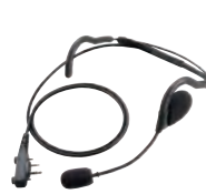
HS-95LWP Hinterkopf-Headset mit Bügelmikrofon für freihändigen Betrieb