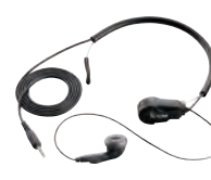
HS-97 und VS-4LA oder OPC-2004LA* Kehlkopf-Mikrofon mit Ohrhörer

* Entweder das VS-4LA oder das OPC-2004LA ist bei Benutzung des Headsets HS-97 erforderlich. VS-4LA: Kabel mit PTT-Taste für manuellen PTT-Betrieb OPC-2004LA: Steckeradapterkabel für freihändigen VOX-Betrieb HS-94 und HS-95 können auch mit VS-4LA oder OPC-2004LA benutzt werden.