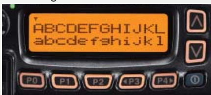
Beispiel für zweizeilige Anzeige

Dank des hohen Kontrasts des Punktmatrix-Displays sind die angezeigten Groß- und Kleinbuchstaben sehr gut erkennbar. Das Display ist so einstellbar, dass eine Zeile mit 12 oder zwei Zeilen mit insgesamt 24 Zeichen dargestellt werden können. Selbstverständlich ist die Anzeige beleuchtet.