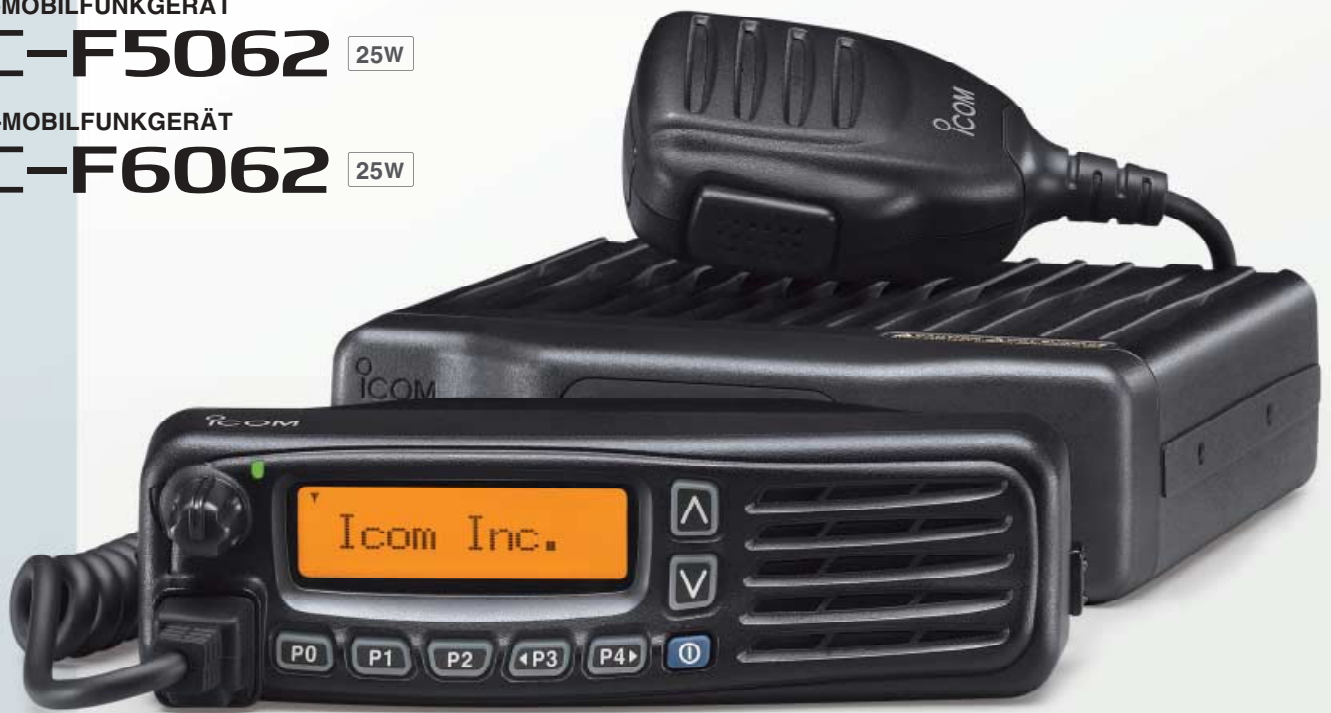
Das Foto zeigt ein Funkgerät mit abgenommenem Bedienteil.