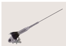
AH-2b ANTENNENELEMENT 2,5 m lange Stabantenne für den Betrieb mit dem AH-4 auf den Bändern zwischen 7 bis 54 MHz.