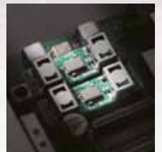
Optionale Filter in der 1. ZF (6 kHz und 3 kHz breit)

Der IC-7410 wird mit einem 15 kHz breiten Roofing-Filter in der 1. ZF geliefert. Optional können bis zu zwei weitere Roofing-Filter nachgerüstet werden. Das FL-431 hat eine Bandbreite von 3 kHz, während das FL-430 6 kHz breit ist. Insbesondere das schmale Filter verbessert die Nahselektion und unterdrückt Störungen in der Nähe des Nutzsignals sehr effektiv. (Bei FM ist das 15-kHz-Filter fest eingeschaltet.)