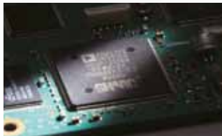
32-Bit-Fließkomma-DSP ADSP-21369 Interne Taktfrequenz: 333 MHz Max. Performance: 2000 MFLOPS

Icom verfügt inzwischen über mehr als 10 Jahre DSP-Know-how und kann dank deutlich schnellerer DSPs beste DSP-Performance realisieren. Unsere Ingenieure haben einen Nachfolger für den IC-7400 entwickelt, auf den jeder Besitzer stolz sein kann. Neben dem leistungsfähigeren DSP wird ein AD/DA-Wandler des Typs AK4620B eingesetzt, der bei einem exzellenten Signal/Rausch-Verhältnis einen größeren Dynamikbereich möglich macht.