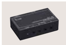
CT-17 CI-V-PEGELKONVERTER Für die Transceiver-Fernsteuerung von einem mit RS232C-Schnittstelle ausgestatteten PC aus.