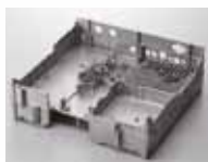
Chassis des IC-7410

Wie das Vorgängermodell hat auch der IC-7410 ein Chassis aus Aluminium-Spritzguss, das die entstehende Wärme auch beim Dauerbetrieb mit maximaler Sendeleistung sehr effektiv ableitet.