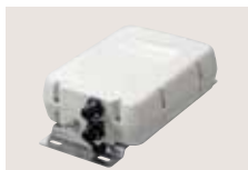
AH-4 KW/50-MHz-AUTOMATIK-ANTENNENTUNER Überstreicht 3,5 bis 54 MHz zur Anpassung einer mind. 7 m langen Drahtantenne.