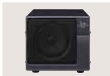
SP-21 EXTERNER LAUTSPRECHER Impedanz: 8 Ω Eingangsleistung: max. 5 W