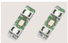
FL-430 1. ZF-FILTER (6 kHz) FL-431 1. ZF-FILTER (3 kHz) Filter für die 1. ZF zur Verbesserung der Empfänger-Performance.