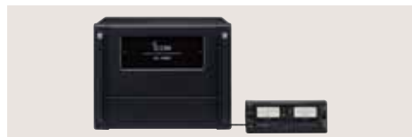
IC-PW1EURO KW/50-MHz-1-kW-LINEARENDSSTUFE Überstreicht alle KW- und 50-MHz-Bänder, erzeugt stabile 1 kW Sendeleistung. Automatischer Antennentuner eingebaut, abnehmbares Bedienteil im Lieferumfang, 2 Transceivereingänge.

Verschiedene Zubehörteile sind in einzelnen Ländern möglicherweise nicht verfügbar. Fragen Sie Ihren Händler.