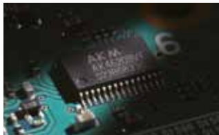
AD/DA-Wandler AK4620B ADC-Signal/(Noise+Distortion): 100 dB ADC-Dynamikbereich, S/N: 113 dB DAC-Signal/(Noise+Distortion): 97 dB DAC-Dynamikbereich, S/N: 115 dB