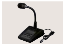
SM-50 TISCHMIKROFON Dynamisches Tischmikrofon mit [UP]/[DOWN]-Tasten und Hochpass-Funktion.