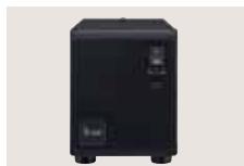
PS-126 NETZTEIL Netzteil mit 4-poligem Kabel. Ausgangsspannung: 13,8 V DC (max. 25 A)