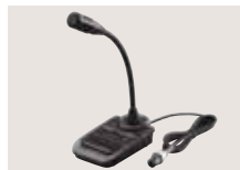
SM-30 TISCHMIKROFON Leichtes Electret-Tischmikrofon mit [UP]/[DOWN]-Tasten und Hochpass-Funktion. SM-20 ebenfalls verfügbar.