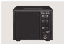
SP-23 EXTERNER LAUTSPRECHER 4 NF-Filter; Kopfhörerbuchse. Impedanz: 8 Ω Eingangsleistung: max. 5 W